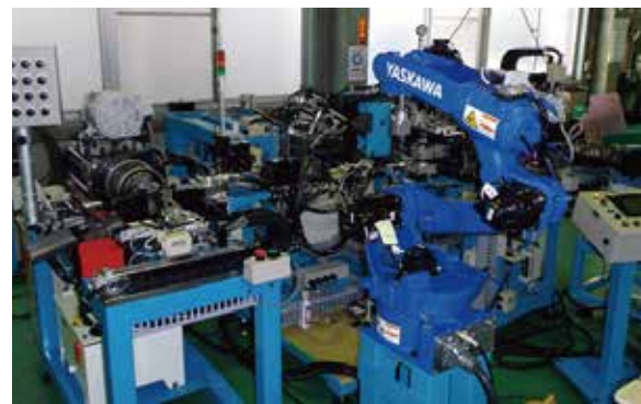
パイプ端末加工 ～曲げ～後端末加工～検査の自動ライン