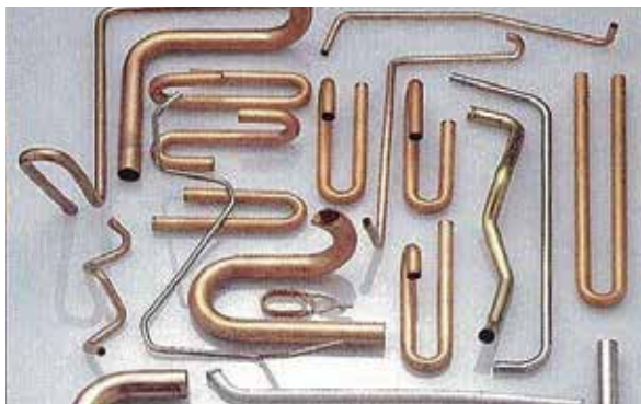
オスガーマシンのパイプベンダーでの加工サンプル